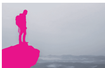
Drukbestand met "Spot1" laag voor witte tegendruk